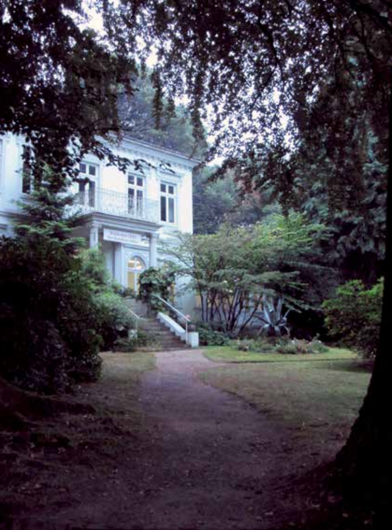
Kunstigalerii Cohrs-Zirus asub 1875. aastal ehitatud luksuslikus villas. Omal ajal oli see üks ihaldatumaid näitusepaiku Worpswedes.