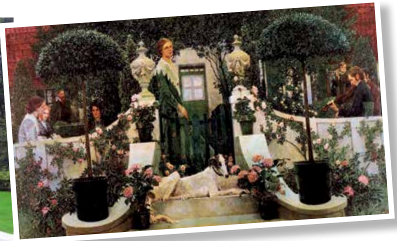
Worpswede ümbrus ja inimesed oli kunstnikele ammendamatu inspiratsiooniallikas ning see kajastus ka nende töödes. Heinrich Vogeleri „Kevad” (1897) mõjub kui foto kidurate sookaskede vahel jalutavast noorest naisest. Tema üks romantilisemaid töid on kodumaja trepil maalitud „Suveõhtu” (1905). Teoste originaalid on väljas Worpswedes.