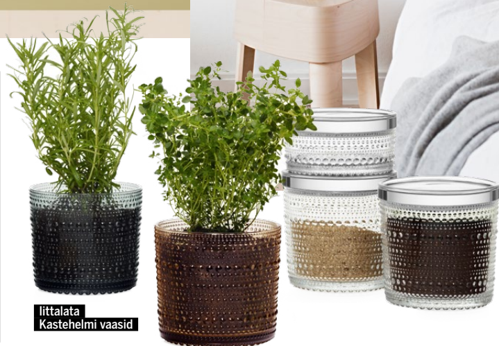
Iittalata Kastehelmi vaasid

Finlayson suudab üllatada! Provokatiivne homoerootiline Tom of Finlandi kollektsioon on kumardus omanäolisele soome kunstnikule Touko Laaksonenile. Kolleksioon ei piirdu stiilse ja luksusliku must-valge satiiniist voodipesu