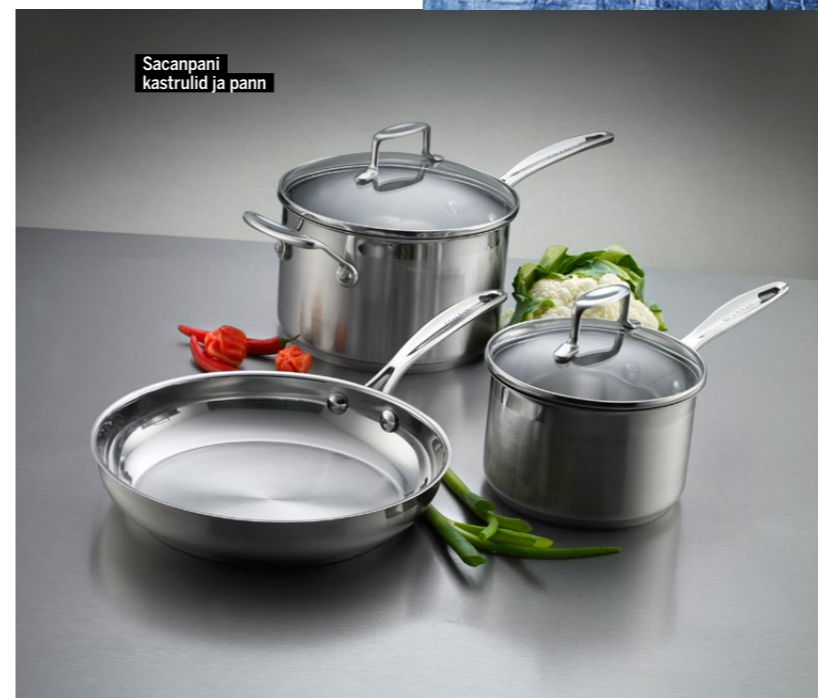
Scanpani kastrulid ja pann