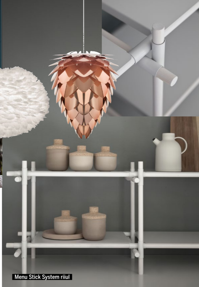
Menu Stick System riiul

õilistuvad tänu selgetele ja säravatele värvidele – see on Eva Solo käekiri. Üheks tugevaimaks liiniks Eva Solo toodetesarjas on olnud ajast aega karahvinid, dekanterid, joogipudelid, kohvi- ja teekannud, termosed, klaasid ja pokaalid. Nende karahvinid ja kannud on lisaks suurepärasele disainile ka 100% tilgakindlad – tehnoloogiline uuendus, mis on maailmas ainulaadne.