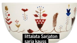
Iittalata Sarjaton sarja kauss

komplektidega, maskuliinsed mehepojad vaatavad vastu ka puuvillastel käterätikutel ja vannilinaldel ning mänguliselt jätkub köögiski.