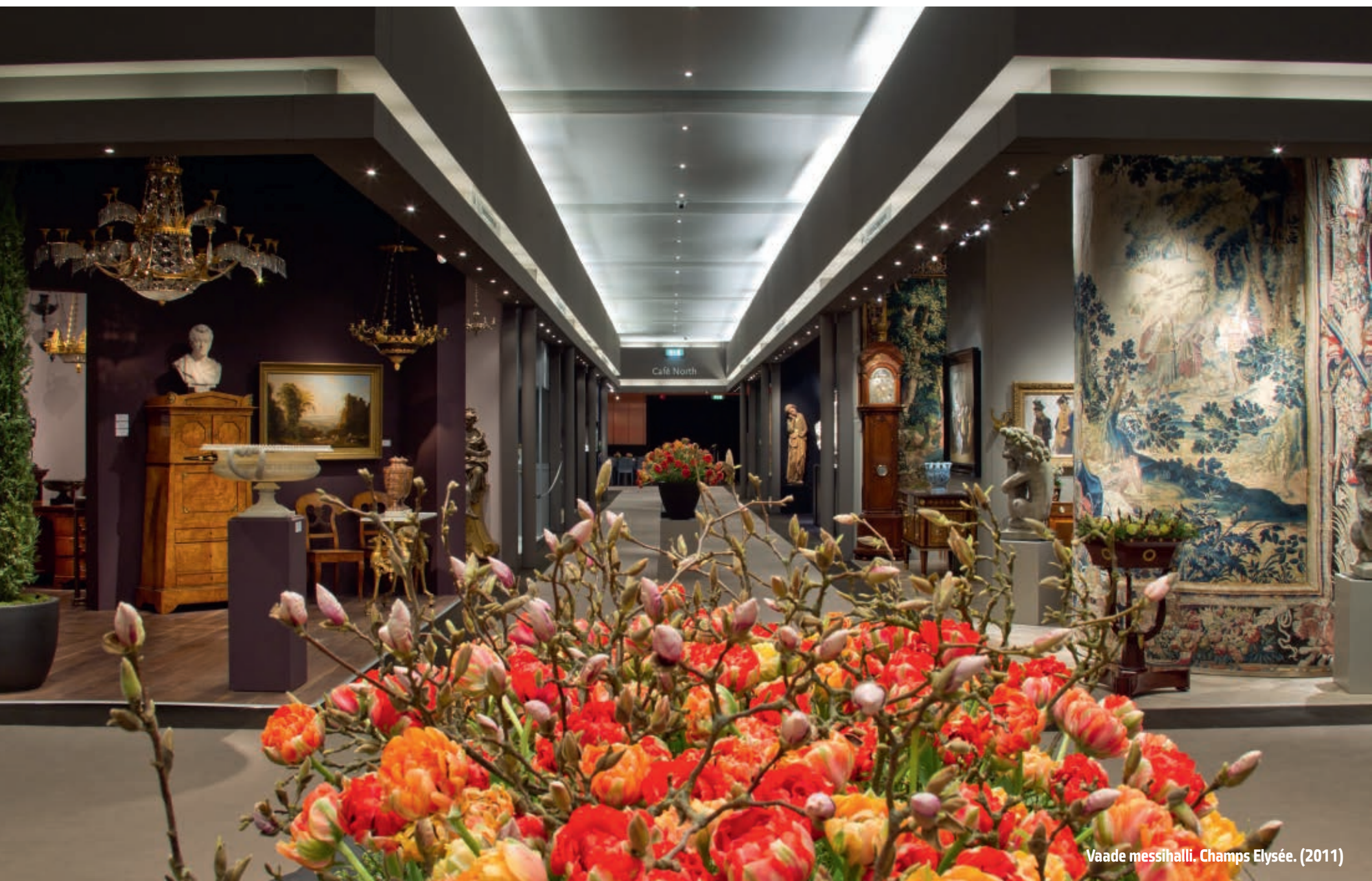
Vaade messihalli. Champs Elysée. (2011)