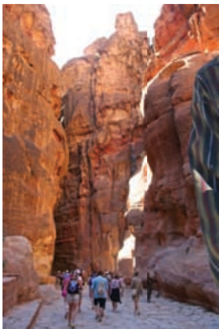
Kõik teev viivad Petrasse.

Kui te oma jalgsirännakut mööda tolmust, hobuste ja eeslite uriini ja sõnniku järele lõhnavat peamist juur-