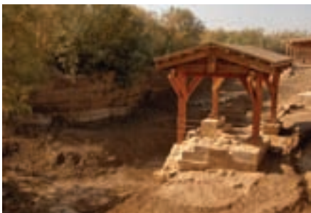
Ristimispaik Jordani jõe kaldal Bethany's.

Nagu juba loo alguses öeldud, on paljud Püha Maa legendaarsed paigad just tänase Jordani territooriumil ja üks neist on Jordani idakaldal asuv Bethany – paik kus Johannes iidsetel aegadel Jeesuse ja tema jüngrid ristas. Külake nimega Bethabra on aga see paik, kus Johannes elas, jutlustas ja inimesi vette kastis. Siinsamas on ka koht, kus prohver Eelija oma kokkurullitud kuuega jõevoodesse löi ja vesi kahele poole taandus, nõnda, et tema ja viiskümmend meest kuiva jalaga läbi jõesängi astusid. Nii Iisraelis kui Jordaania pakutakse sageli müüa väikestes pudelites püha Jordani vett ning olgu selle päritoluga kuidas on, kuid eriti kristlastest turistid ostavad seda meelsasti kaasa j ausuvad endiselt selle maagilisse jõusse.