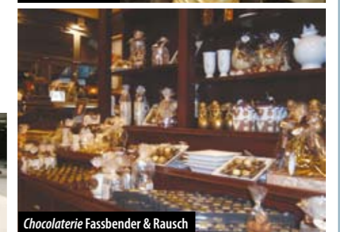
Chokolaterie Fassbender &amp; Rausch