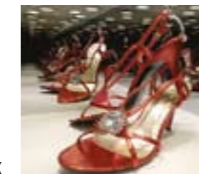
Sterling Goldi vaateaken