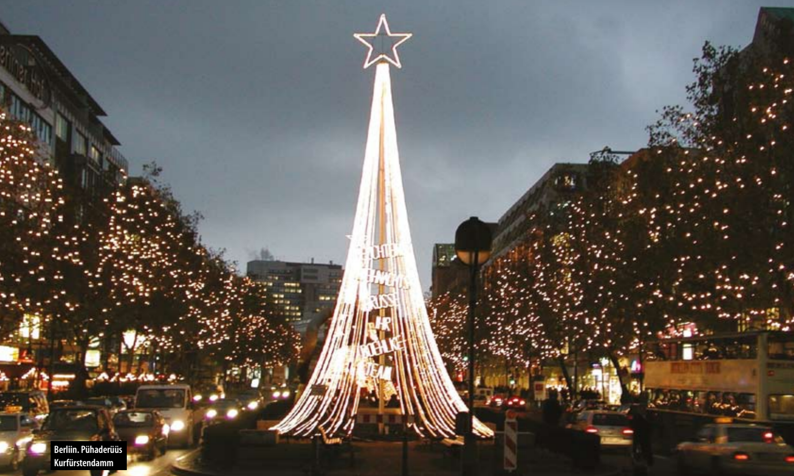
Berliin. Pühaderüüs Kurfürstendamm