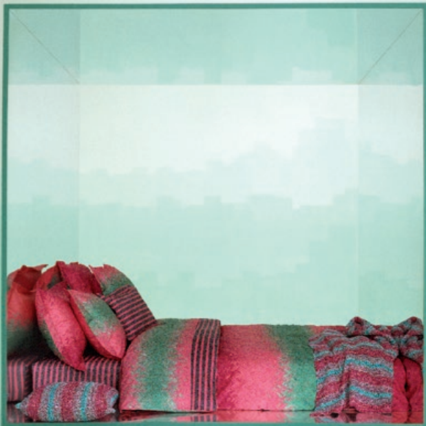
Kenzo sarja Ibiscus padjapüür 50 x 60 cm 53.95 € tekikott 150 x 210 cm 199.95 € aluslina 180 x 290 cm 199.95 €

tavaline samm, kuid sai võimalikuks vaid seetõttu, et kool avas lõpuks oma ukse ka meessoost tudengitele.