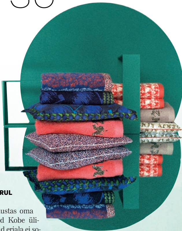
Erinevad sarjad: Félin, Logokz, Natté, Bluebay.

Kenzo Takada alustas oma kõrgkooliõpinguid Kobe ülikoolis, kuid valitud eriala ei sobinud talle kuidagi. Vanemate vastuseisust hoolimata jättis ta õpingud pooleli ja astus 1958. aastal Tokyo Bunka moekolledžisse. 1919. aastal asutatud õmbluskool oli kurikuulus oma üliorangete vastuvõtutingimuste, karmi distsipliini ja suure töökoormuse poolest, kuid just siin hakati välja andma Jaapani esimest moeajakirja Soe-en. Takada õppima asumine n-õ naisterialale ja naistekooli oli eba-